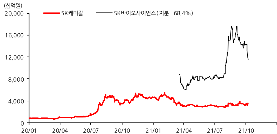
[그림22] SK 케미칼 시가총액 및 SK 바이오사이언스 지분(68.4%) 가치